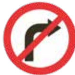
2.42.60.A Interdiction d'obliquer à droite