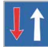
3.10.50.A Priorité par rapport aux véhicules en sens inverse