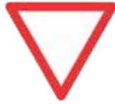
3.02.90.A Cédez le passage