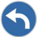
2.38.60.A Obliquer à gauche