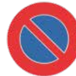
2.50.60.A Interdiction de parquer