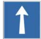
4.08.50.A Sens unique