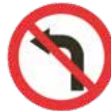
2.43.60.A Interdiction d'obliquer à gauche