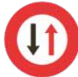
3.09.60.A Laissez passer les véhicules venant en sens inverse