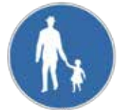
2.61.60.A Chemin pour piétons