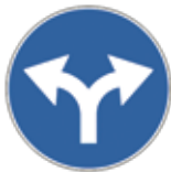
2.39.60.A Obliquer à droite ou à gauche